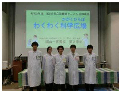
わくわく科学広場