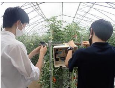
岡山興陽高校との連携

自分たちが学んだことを地域に発信したり、興味・関心を同じくする仲間たちと校内外を問わず繋がったりしましょう。年齢や立場、環境の違う人たちと触れ合うことで思わぬ化学反応が起こるかもしれません。そこで得た学びを力に変えていきましょう。