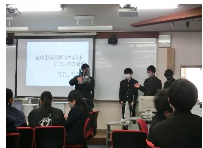
数学・情報分野の発表