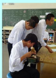
制作過程の相互観察

何回も美術科を習ったことがある。彫る作業は、彫る順番や彫る角度などを決めておく必要がある。今回は、1時間での彫りでは、この目標を立てることが難しいと感じた。 ・自分が思った通り、感じたとおりにつくった達成感